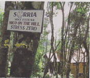
A Pousada Nico on the Hill tem ambiente ideal para os dias mais românticos e atendimento personalizado